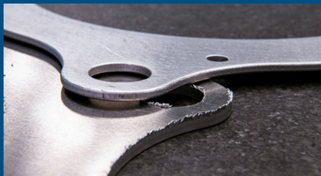
Peças de corte laser antes e depois de processadas na EdgeBreaker® 6000.